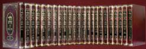
פורמט רגיל (cm 24/17)