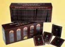
פורמט כיס "ובלכתך בדרך" מהדורת ר' יוסף צבי בערנער (cm 16.5/11.5)